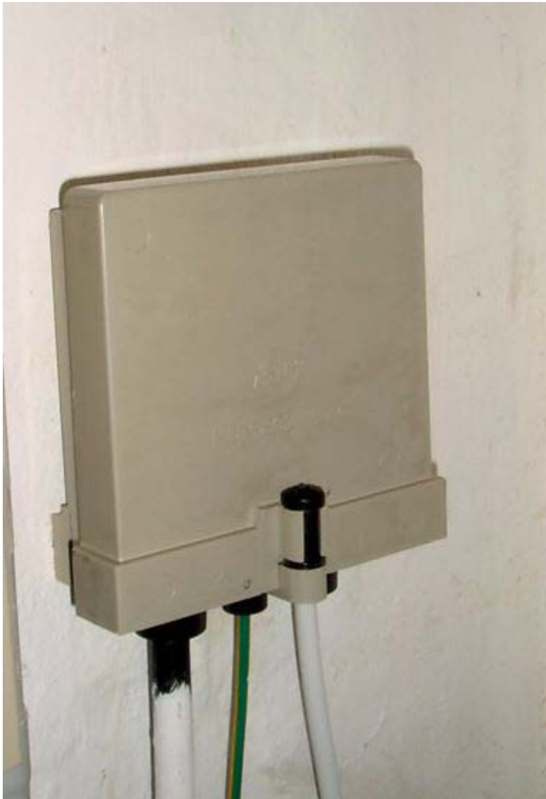
Beispiel für einen Hausübergabepunkt mit angeschlossenen Koaxialkabeln; Maße: ca. 110 mm x 130 mm x 60 mm (B x H x T)

Der HÜP ist die Abgrenzung zwischen der Netzebene 3 (örtliches Verteilnetz) und der Netzebene 4 (Hausnetz). Er befindet sich oftmals im Keller oder im Hausanschlussraum (bei Neubauten) der angeschlossenen Häuser. Zwischen HÜP und den Antennendosen erstreckt sich das Hausnetz bestehend aus Koaxialleitungen, Verstärkern, Abzweigern und Verteilern.