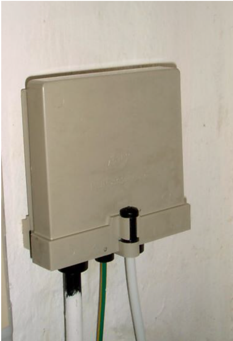
Beispiel für einen Hausübergabepunkt mit angeschlossenen Koaxialkabeln; Maße: ca. 110 mm x 130 mm x 60 mm (B x H x T)

Der HÜP ist die Abgrenzung zwischen der Netzebene 3 (örtliches Verteilnetz) und der Netzebene 4 (Hausnetz). Er befindet sich oftmals im Keller oder im Hausanschlussraum (bei Neubauten) der angeschlossenen Häuser. Zwischen HÜP und den Antennendosen erstreckt sich das Hausnetz bestehend aus Koaxialleitungen, Verstärkern, Abzweigern und Verteilern.